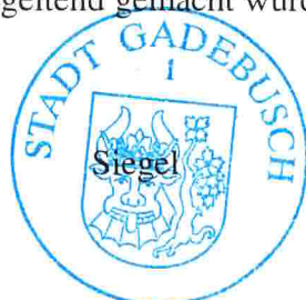
Howest Bürgermeister der Stadt Gadebusch

Verfahrensvermerk: Diese Bekanntmachung wird am 18.09.2015 auf der Internetseite des Amtes Gadebusch ( www.gadebusch.de ) veröffentlicht und im öffentlichen Bekanntmachungskasten am Rathaus ausgehängt für die Dauer der Auslegungsfrist