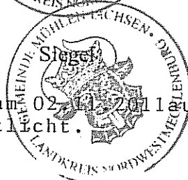
Ahrens Der Bürgermeister