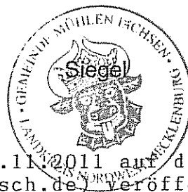
Ahrens Der Bürgermeister

Diese Bekanntmachung wird am 02.11.2011 auf der Internetseite des Amtes Gadebusch ( www.gadebusch.de ) veröffentlicht.