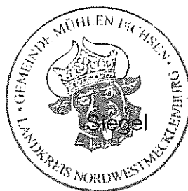
Ahrens Der Bürgermeister